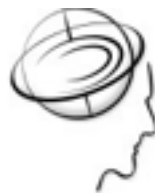
LIGA GUATEMALTECA DE HIGIENE MENTAL